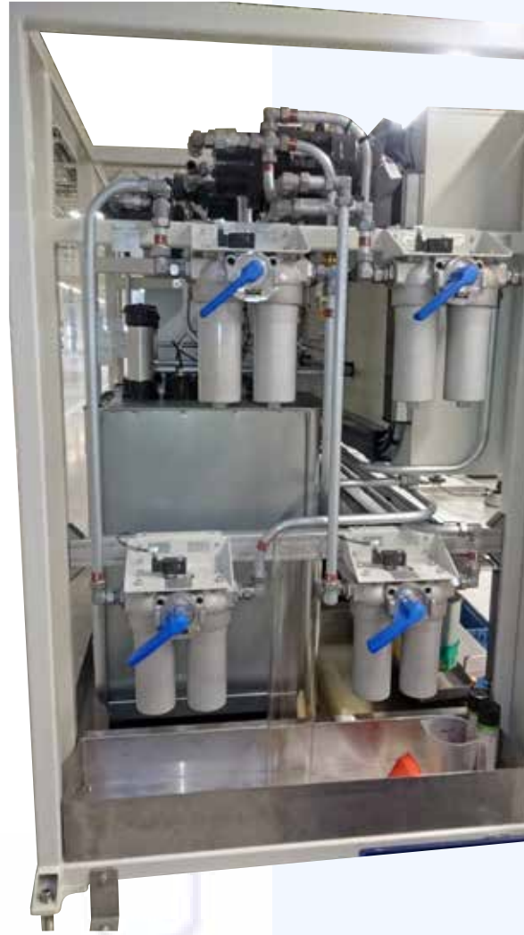
Öl-Umschaltfilter für jeden Befüllkanal