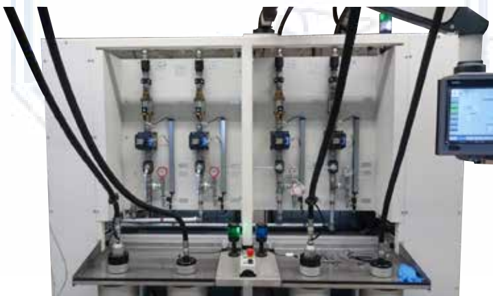
Bedienseite mit 2 Befüllkopf-Sets

Die Informationen in dieser Broschüre enthalten allgemeine Beschreibungen bzw. technische Leistungsmerkmale. Druckfehler & technische Weiterentwicklung vorbehalten. Den für Ihren konkreten Anwendungsfall zutreffenden Leistungs- und Lieferumfang, sowie die Ausführungsvarianten bitten wir mit unserem Vertriebsteam abzustimmen