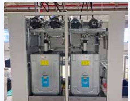
400 l Öl-Vorratsbehälter