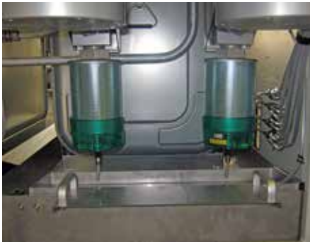
Venturi - Prinzip Befüllkopf - Absaugung